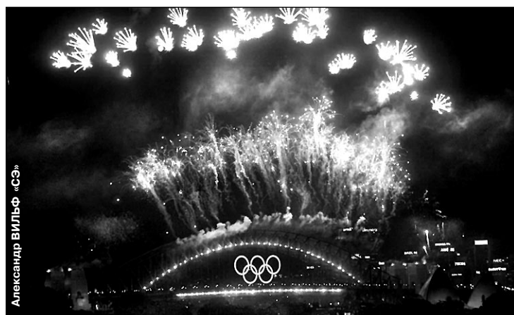
Вчера. Сидней. Последний салют Олимпиаде!