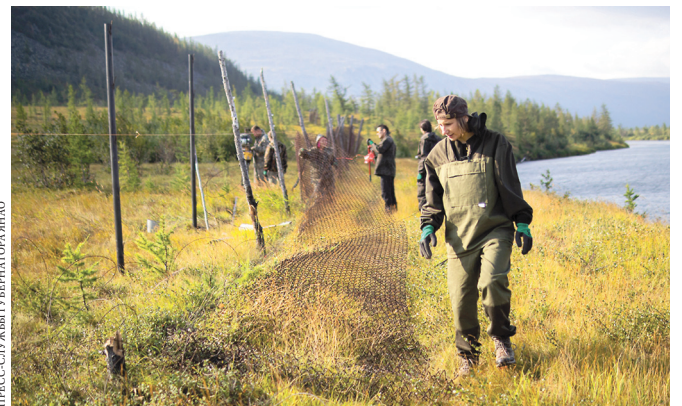
ПРЕСС-СЛУЖБА ГУБЕРНАТОРА ЯНАО

За неделю волонтеры отремонтировали три километра ограждения вольера для мускусных быков.