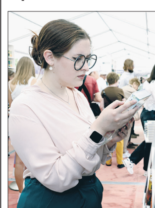
Девушка с книгой

ВЦИОМ изучил, что читают россияне. Респондентам задавали вопрос, что они читали за последнюю неделю. Самым популярным результатом оказались книги. Художественную литературу читали 40% опрошенных. На втором месте идут новости и социальные сети. Популярность книг выросла за последние годы — в 2020 г. соцсети читали 40%, СМИ — 39% и только за ними шли книги, которые читали 35% опрошенных. При этом наибольший интерес к литературе, как оказалось, проявляет «поколение цифры» — среди всех возрастных групп наибольшая доля любителей книг оказалась среди людей, родившихся после 2000 года — 50%.