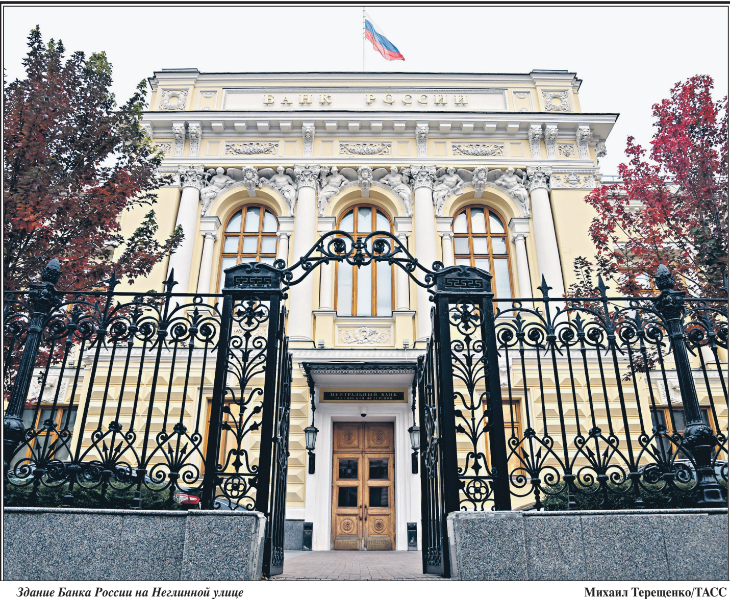
Здание Банка России на Неглинной улице