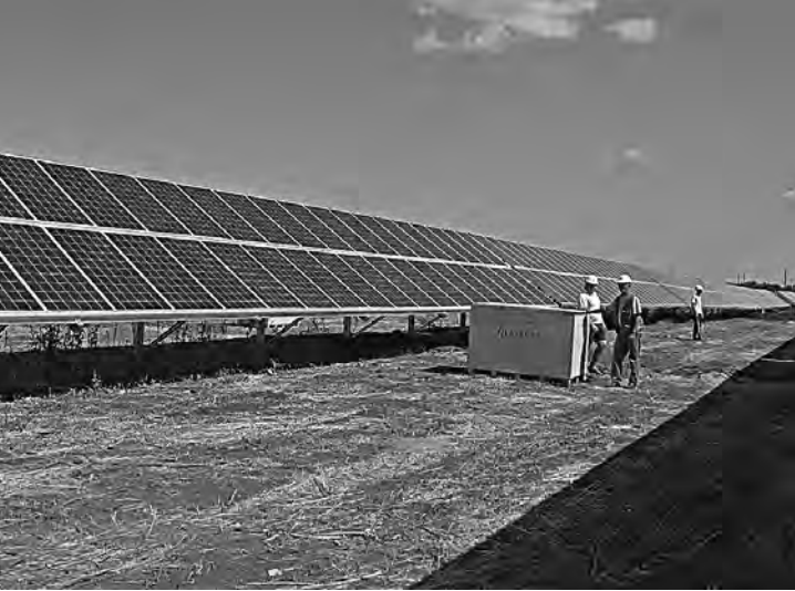
Солнечная электростанция под Пугачевом экологически безопасна.

В планах компании-инвестора (ГК «Хевел») – довести мощность солнечных электростанций в регионе до 100 МВт.