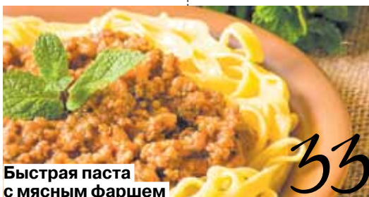
Быстрая паста с мясным фаршем