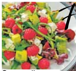
Зеленый салат с сыром и ягодами