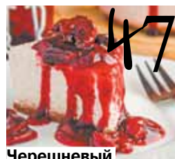
Черешневый чизкейк без выпечки