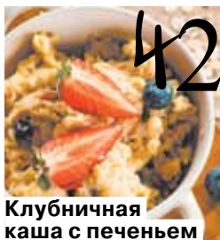
Клубничная каша с печеньем