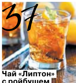
Чай «Липтон» с ройбушем