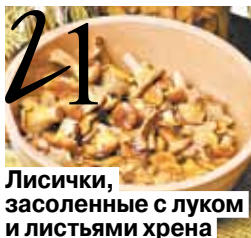
Лисички, засоленные с луком и листьями хрена