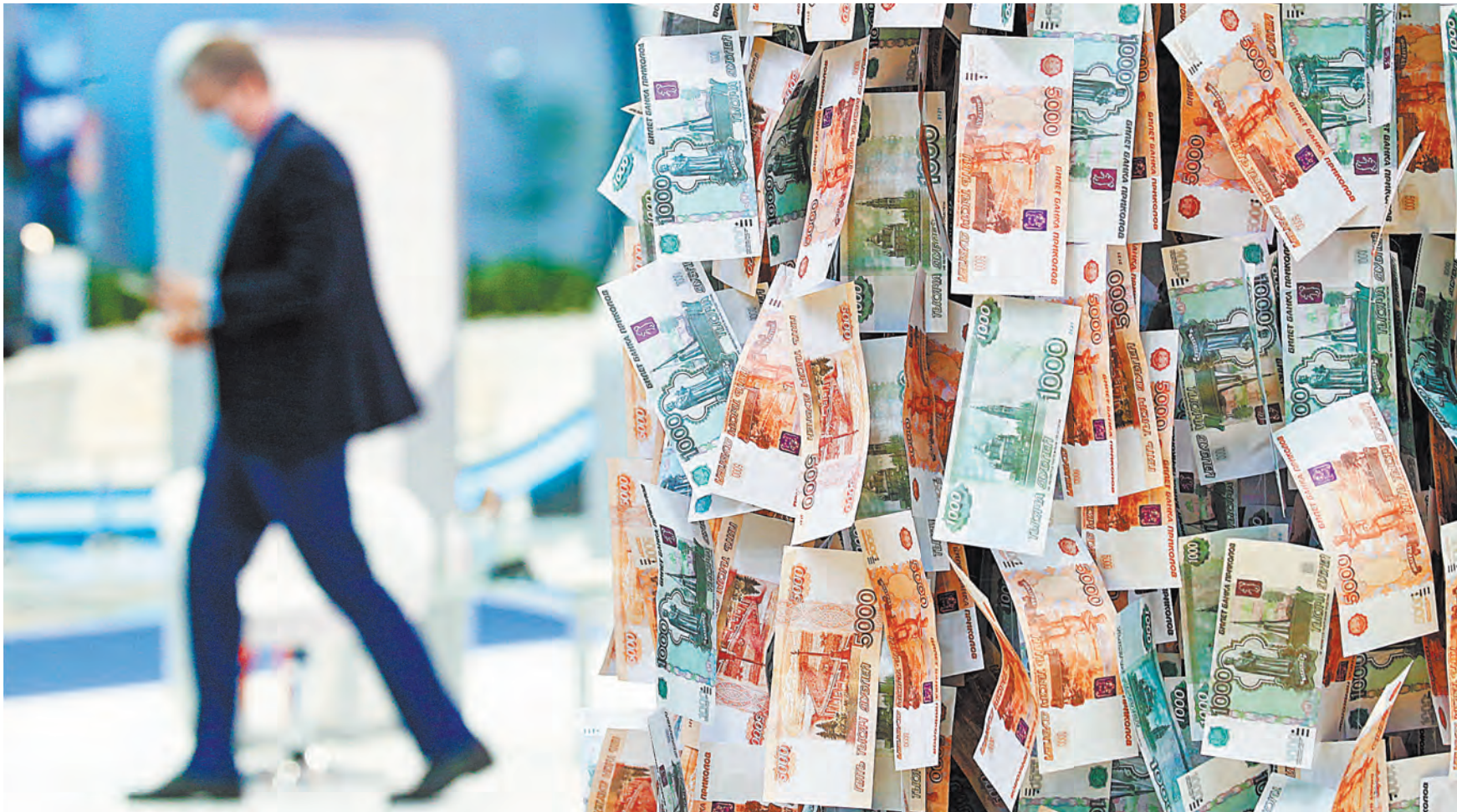
Нормальная разница между самой высокой и самой низкой зарплатой — 3–5 раз.

Более чем в тринадцать раз достиг в этом году разрыв между самыми низкими и высокими зарплатами. Если первые составляют 12,2 тысячи рублей в месяц, то вторые — 164,7 тысячи. Это в среднем по стране. А что происходит «на земле» — в конкретном регионе?