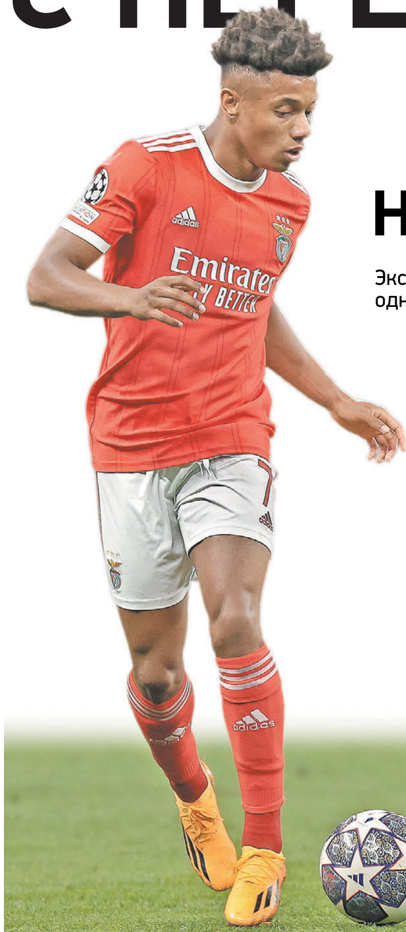
Атакующий хавбек «Бенфики» Давид Нерес

чемпионских титула взял Давид Нерес за последние пять лет – три с «Аяксом» в Нидерландах, один с «Бенфикой» в Португалии