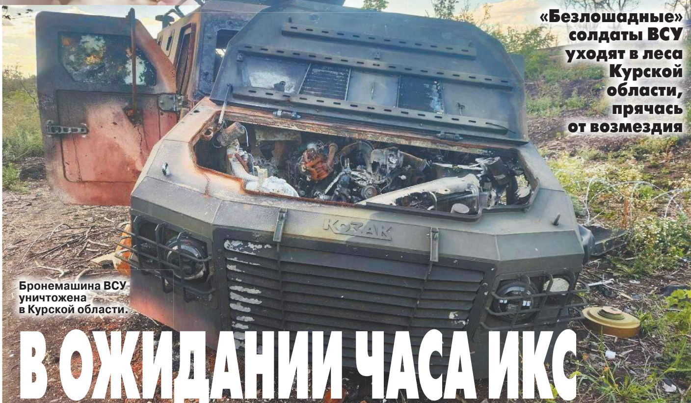
Бронемашина ВСУ уничтожена в Курской области.

«Безлошадные» солдаты ВСУ уходят в леса Курской области, прячась от возмездия