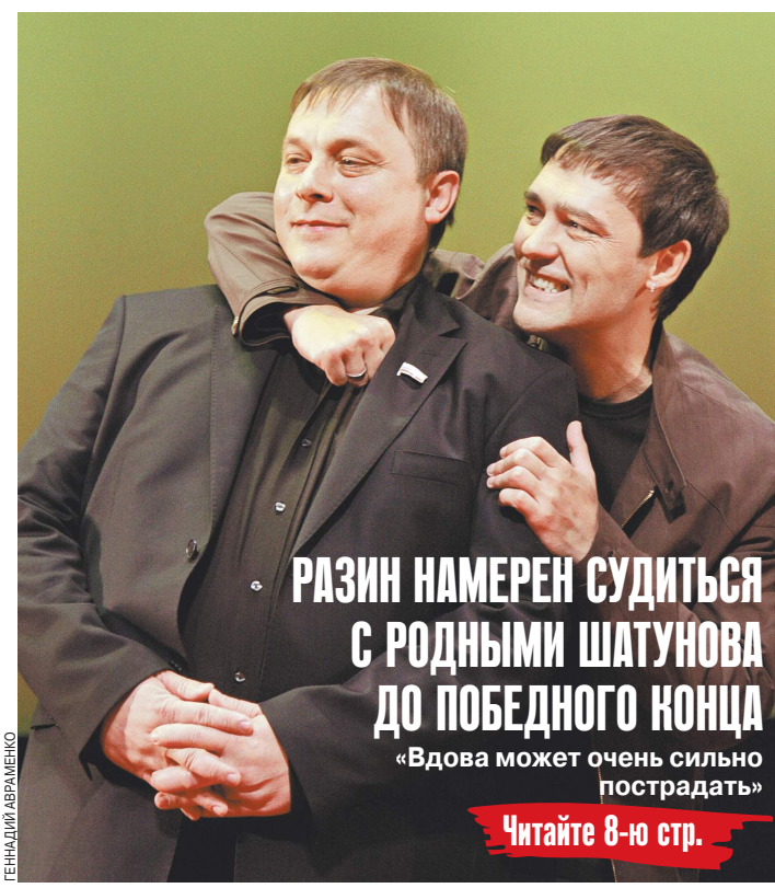
РАЗИН НАМЕРЕН СУДИТЬСЯ С РОДНЫМИ ШАТУНОВА ДО ПОБЕДНОГО КОНЦА