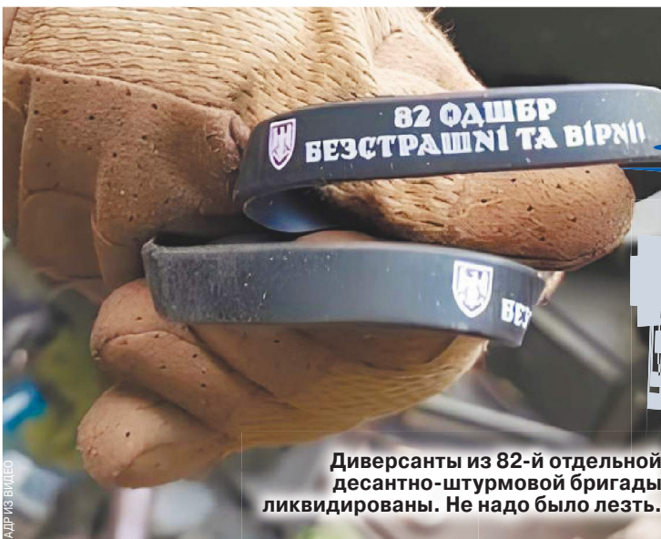
Диверсанты из 82-й отдельной десантно-штурмовой бригады ликвидированы. Не надо было лезть.