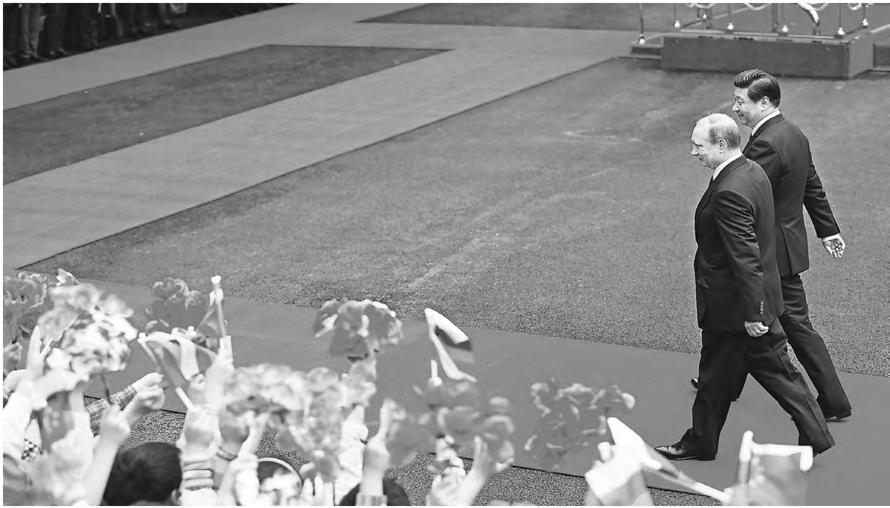
Началу переговоров президента РФ Владимира Путина с председателем КНР Си Цзиньпином предшествовала официальная церемония встречи главы Российского государства.