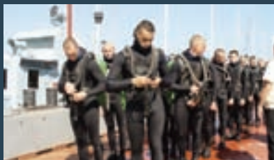
ОРУЖИЕ БОЕВЫХ ПЛОВЦОВ