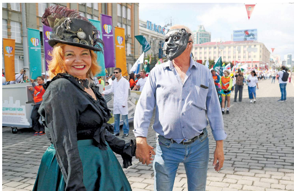
Екатеринбуржцы проявили фантазию, наряжаясь на праздник.