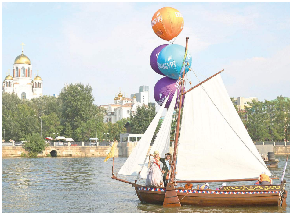
Точная копия ботика Петра I изготовлена карельскими кораблестроителями.