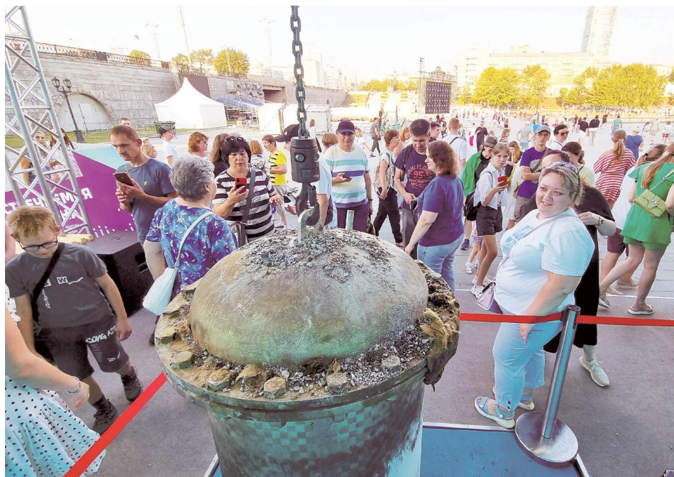
Капсула пролежала в земле 50 лет.

Общественный транспорт Екатеринбурга не справился с наплывом людей, желающих добраться домой после праздничного салюта. Тысячи горожан устраивали заторы при входе в метро, штурмовали автобусы. Толпа двигалась по проезжей части вместе с автомобилями и трамваями.