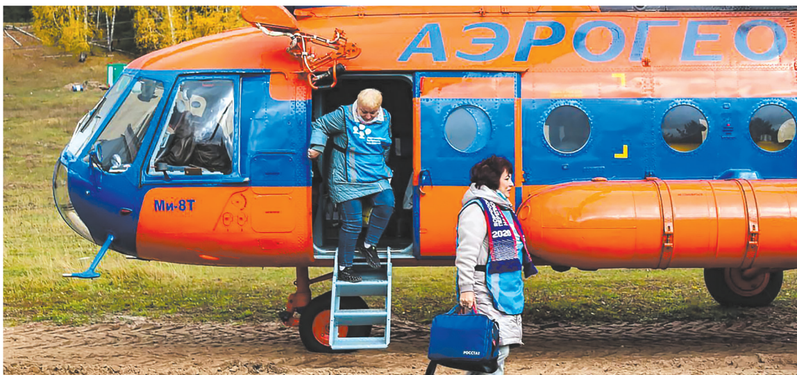
ПРАВИТЕЛЬСТВО КРАСНОЯРСКОГО КРАЯ