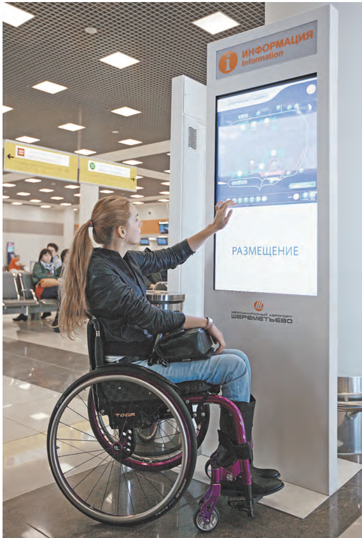
Одной из основных тем на коллегии стала проблема создания доступной среды для людей с ограниченными возможностями.

Найти работу на просторах Союзного государства гражданам Беларуси и России стало проще