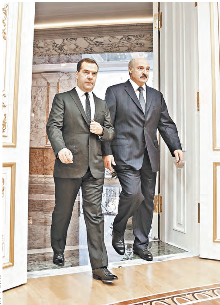
Заседание Совета Министров Союзного государства предрешило встречу премьер-министра РФ Дмитрия Медведева с Президентом Беларуси Александром Лукашенко.