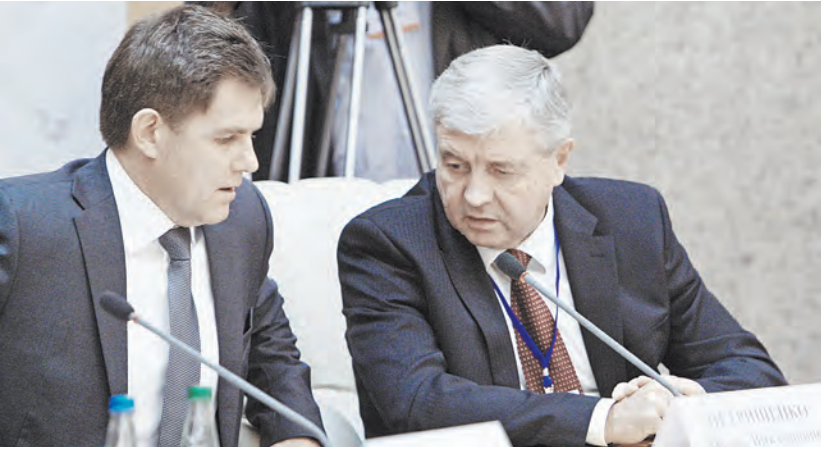
Посол Беларуси в России Игорь Петришенко (слева) сразу после Совмина улетел в Новосибирск на Дни Беларуси в Сибири.