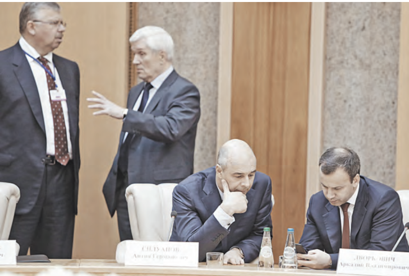
Вместе с российским премьером в Минск приехал почти весь кабинет министров.

Формат Союзного государства с созданием ЕАЭС не исчезнет, а, наоборот, будет последовательно укрепляться