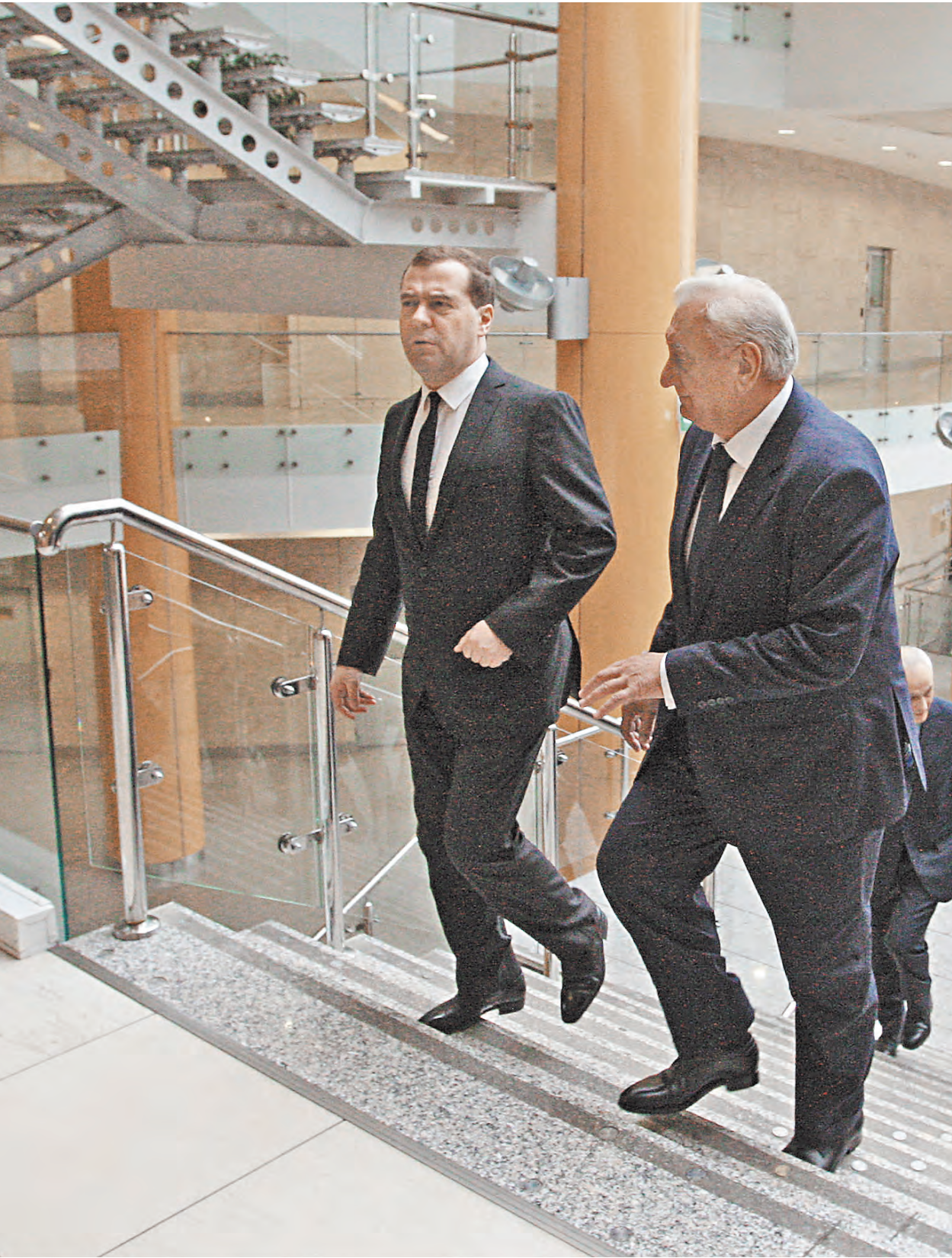
Премьер-министр России Дмитрий Медведев и его белорусский коллега Михаил Мясникович сошлись во мнении, что Союзное государство является особым интеграционным образованием, не имеющим аналогов по широте сотрудничества.

Григорий Рапота | Есть одна особенность, которая будет действовать с сегодняшнего дня, — новый порядок формирования бюджета. Соответствующий документ направлен на повышение эффективности использования средств, которые нам выделяют. Чтобы