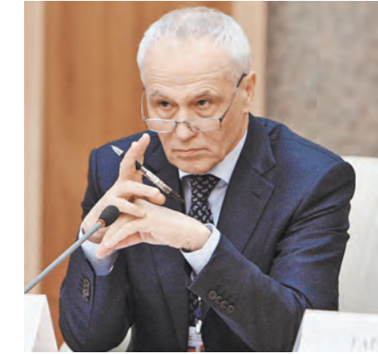
Госсекретарь Союзного государства Григорий Рапота: Нам очень важно взглянуть, где мы стоим и куда мы должны двигаться.

Однако Союзное государство строится не только на общем экономическом фундаменте. Это еще и общая история белорусов и россиян. И не все страницы в ней радостные. Об этом еще раз напомнил Дмитрий Медведев, обратив внимание журналистов на скорбную годовщину уничтожения фашистами Минского гетто. Но была и остается с нами общая Великая Победа, 70-летие которой наши народы вскоре будут вместе отмечать. На этой ноте высокие российские гости отправились знакомиться с новым Музеем Великой Отечественной войны.