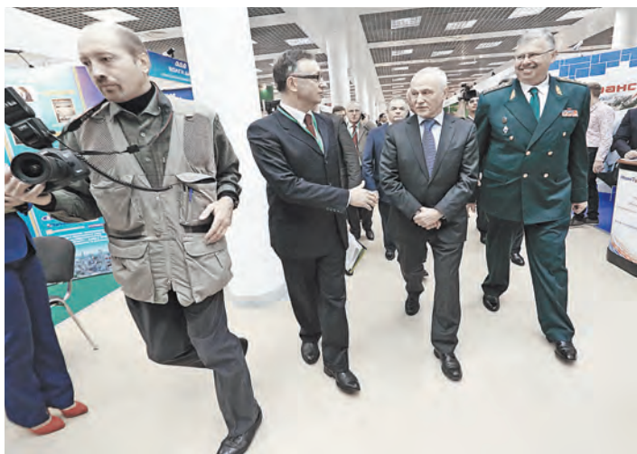
Ожидается, что в этом году выставку посетят представители официальных делегаций из 20 стран.

выставку посетят представители официальных делегаций из 20 стран. В прошлом году на ней побывали более девяти тысяч человек.