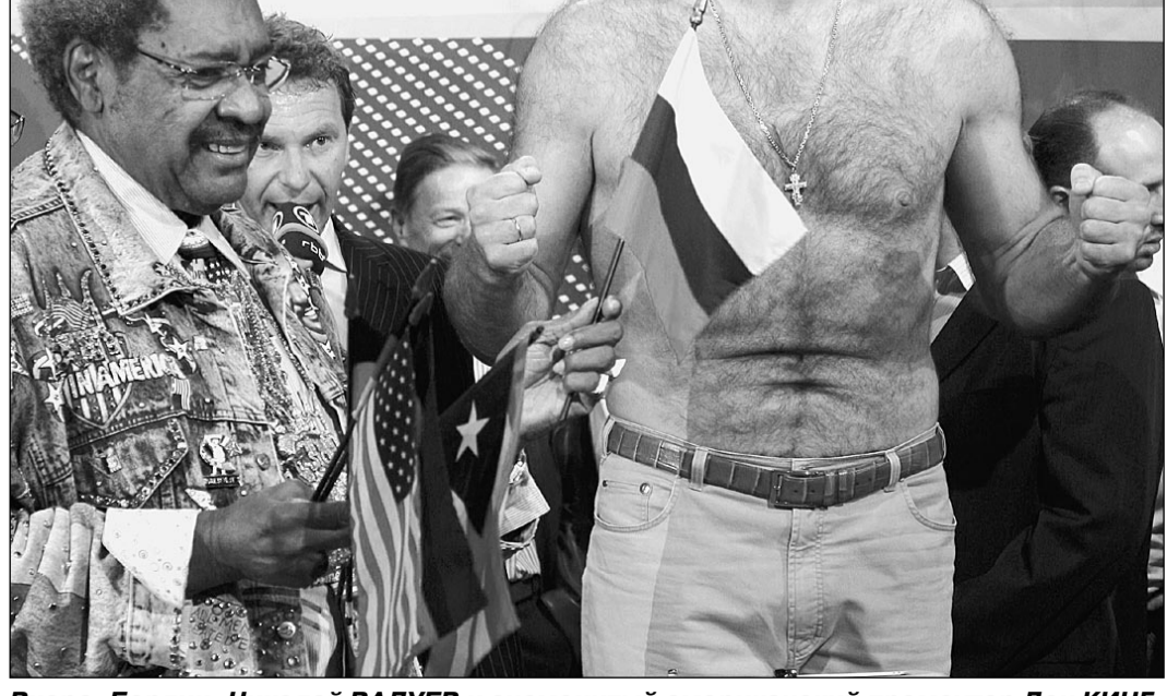
Вчера. Берлин. Николай ВАЛУЕВ и знаменитый американский промоутер Дон КИНГ.