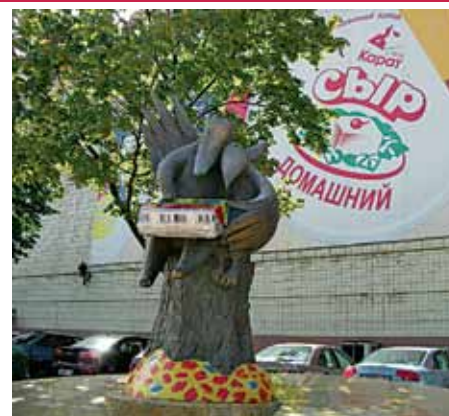
Памятники (слева направо): плавленому сырку «Дружба» в Москве; ижевскому пельменю и луховицкому огурцу

В России бум на смешные памятники начался позже, чем на западе. Зато с тех пор, как шуточные фигуры дворников, электромонтеров, сантехников, литературных персонажей стали теснить на улицах наших городов бронзово-гранитных деятелей государства и культуры, замерших в важных позах, в области веселых монументов наша страна явно выдвигается «вперед планеты всей».