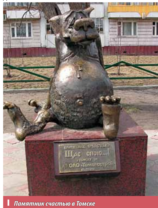
Памятник счастью в Томске

К любителям истории можно отнести и членов клуба почитателей знаменитого исторического персонажа – «Внучата Мюнхгаузена». С открытием необычного памятника в Калининграде зародилась новая традиция: ступив внутрь сапога, желающие клянутся никогда не врать. В городе появилась новая точка притяжения туристов и экскурсантов, складываются новые маршруты для посетителей.