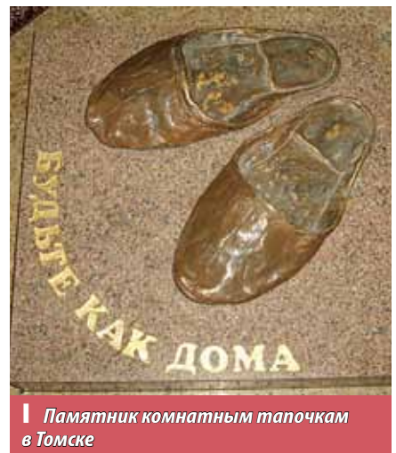
Памятник комнатным тапочкам в Томске

А село Париж Нагайбакского района Челябинской области, как и полагается Парижу, имеет свою Эйфелеву башню. Южноуральский триумф инженерной мысли ничем не хуже главного символа французской столицы, ну, разве что размерами поменьше – всего пятьдесят метров в высоту вместо оригинальных трехсот. Но на фоне одноэтажных изб все равно возвышается. В ближайшее время парижане собираются открыть у подножия сооружения кафе «Мулен-Руж», и уже