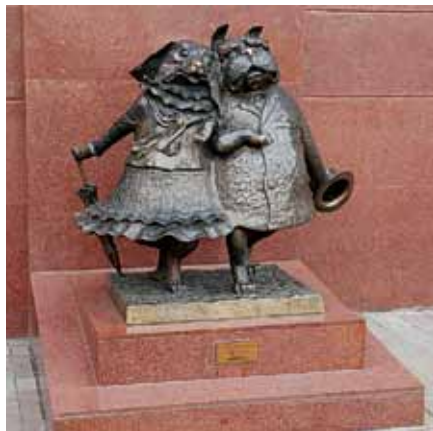
Памятник двум собакам в Краснодаре

Екатеринбурге почти два квадратных метра занимает памятник компьютерной клавиатуре. В ярославском городе Мышкине установлен памятник валенку, в Дмитровграде – российскому рублю.