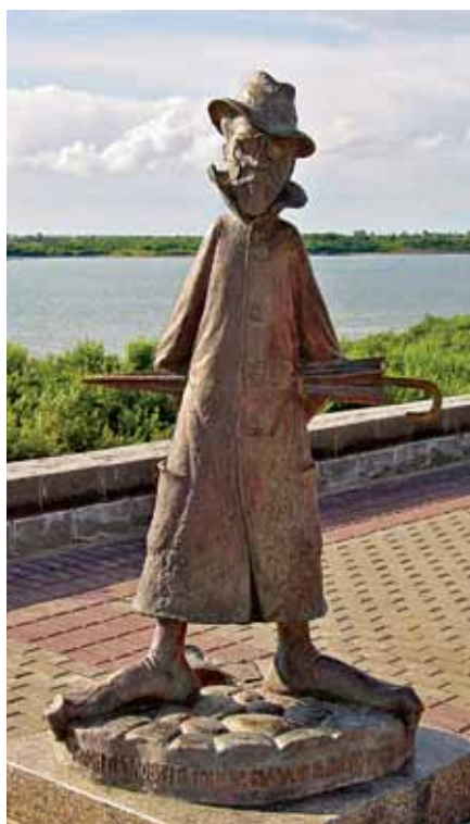
Памятник А.П.Чехову в Томске

Не забыты и продукты питания. В Москве увековечен знаменитый плавленый сырок «Дружба», площадь подмосковного поселка Птицеград украшает памятник яйцу, а подмосковный город Луховицы – соленый огурец. Последнее вполне справедливо: огурцы здесь солят по особенному рецепту, и они получаются очень вкусными. В Ижевске удмуртский пельмень накололи на двухметровую вилку.