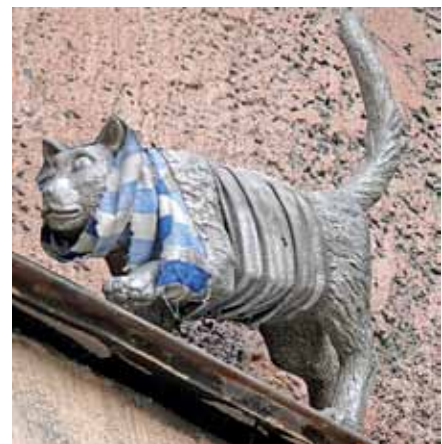
Двоюродный родственник тигра под окнами центра «Митьков»

Геленджик во всех смыслах достойный морской курорт на черноморском побережье России. И набережная тут есть, и неформальные достопримечательности на ней. Тематика их очень разнообразна – от историко-патриотических до развеселых и романтических. Вход в краеведческий музей украшает памятник Герою Советского Союза Цезарю Куникову – бюст офицера в ушанке (уже необычно и где-то даже забавно, хотя если вспомнить русские морозы, то воспринимается все вполне серьезно) помещен почему-то на античную колонну. Напротив местного загса стоит скульптура одинокой невесты в свадебном платье с букетиком, но без жениха. Возле гостиницы «Лукоморье» разместился кот ученый с цепью вокруг дуба. Имеется в этом примечательном кубанском городе и Ассоль, похожая на молодую Анастасию Вертинскую, и доктор Айболит с кроликом, и фонарщик с собачкой. И выпускники, в обнимку стоящие то ли на глобусе, то ли на