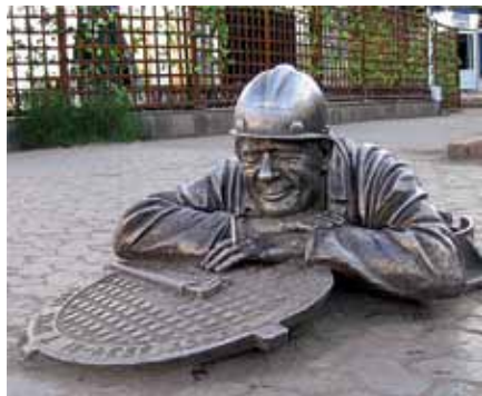
Омский сантехник «Степаныч»

Екатеринбурге почти два квадратных метра занимает памятник компьютерной клавиатуре. В ярославском городе Мышкине установлен памятник валенку, в Дмитровграде – российскому рублю.