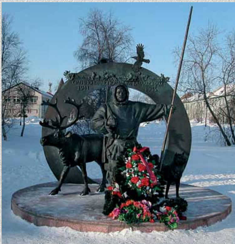
Памятник оленно-транспортным батальонам в г. Нарьян-Мар