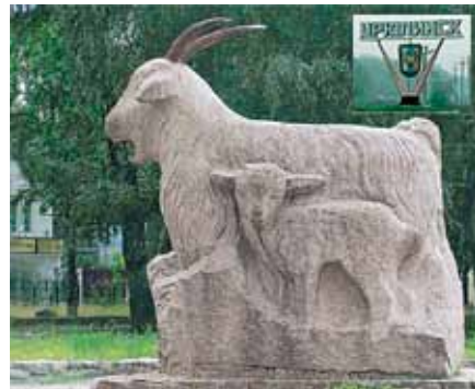
Памятник козе в Урюпинске

В Томске на крыльце гостиницы – бронзовые комнатные тапочки для гостеприимства. А чтоб не выглядеть совсем уж мелочными, Томичи возвели необычный памятник самому А.П. Чехову в ироничной интерпретации: с косыми очками, с непропорционально большими босыми ногами... Дело в том, что писатель, оказавшись