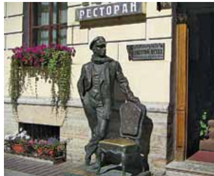
Памятник Остапу Бендеру в Санкт-Петербурге

бурно обсуждают кандидатуры танцовщиц на сельских сходах.