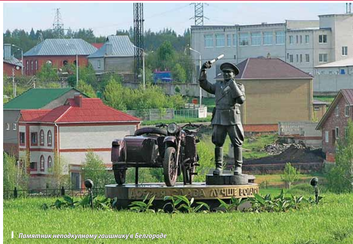
Памятник неподкупному гаишнику в Белгороде

Малые памятники нередко называют странными. И отношение к ним неоднозначное. То ли это причуда, необузданный полет авторской фантазии, то ли отражение краеведческого смысла, то ли брендовая достопримечательность, притягивающая гостей и туристов. Хочется, чтобы и то, и другое было в гармонии.