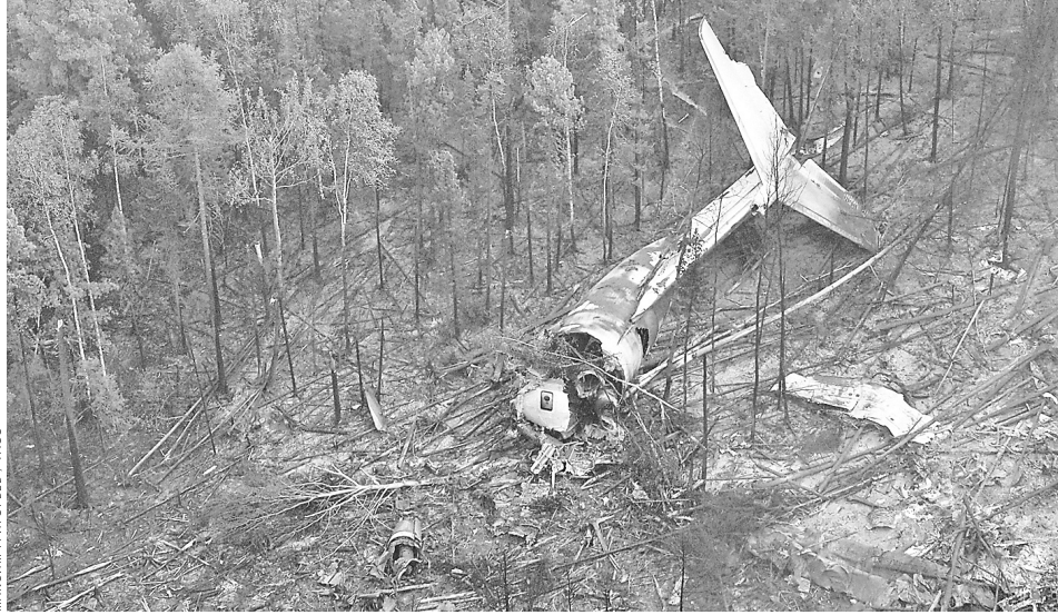
Обломки самолета Ил-76 на месте крушения.

торговля Мировые бренды возвращаются, в России их встречают конкуренты Ушли на покой