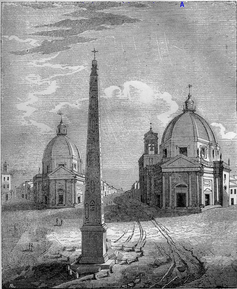
Place du Peuple, à Rome, page 1