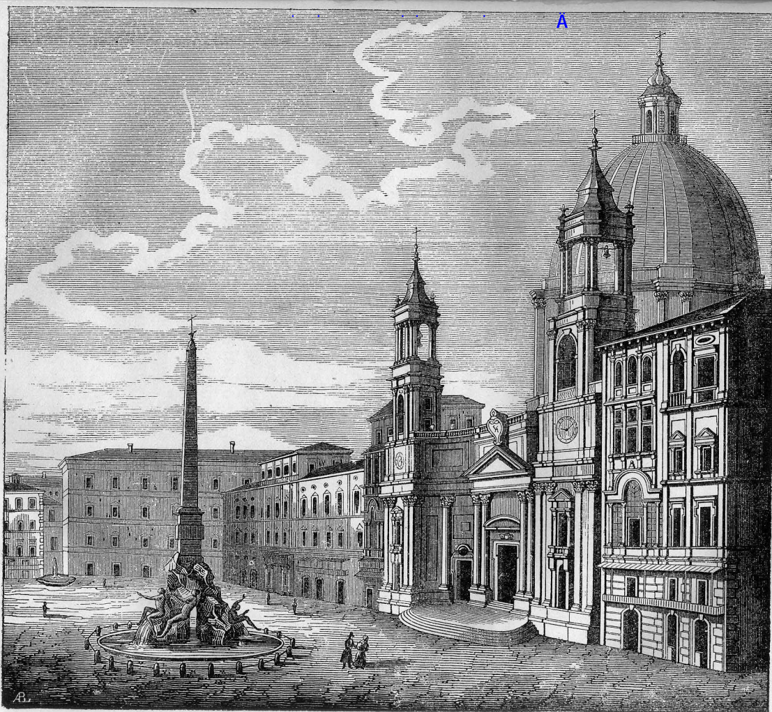
Place Navenne, à Rome, page 1: