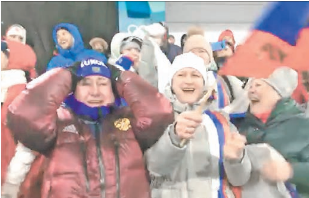
Эмоции президента Федерации лыжных гонок России Елены ВЯЛЬБЕ (слева).

Тяжелейшая Олимпиада в истории отечественного спорта рождает новых героев. Вчера наша команда завоевала три бронзовые награды, каждую из которых можно назвать сенсацией. Упавшее знамя подхвачено. Россия бьется и не отступает!