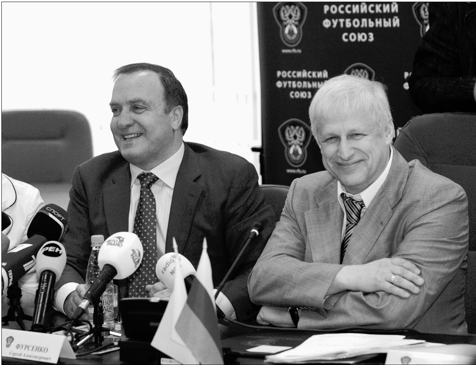
Вчера. Москва. Дом футбола. Дик АДВОКАТ и Сергей ФУРСЕНКО.

Молодые игроки, которые хотят стать великими футболистами, наверняка знают, что для этого надо делать и как себя вести. Тем не менее серьезная задача клубов и клубных тренеров, с которыми эти ребята работают каждый день, - воспитывать, объяснять, помогать им становиться лучше. Еще одна проблема - то, что сегодня футбол стал развлекательной индустрией, в которую вовлечены очень большие деньги. В частности, имею в