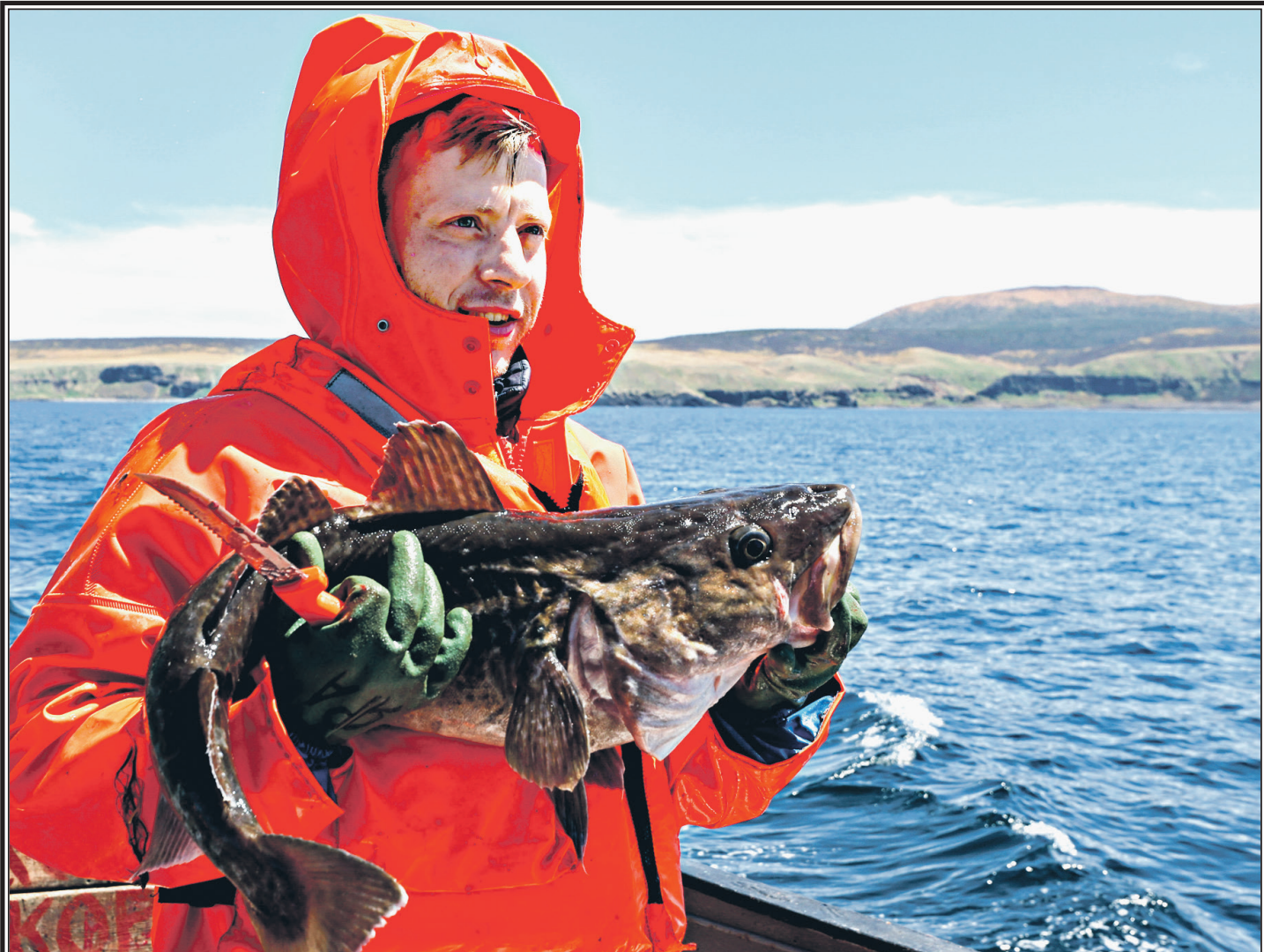
Рыба, выловленная у берегов острова Итуруп