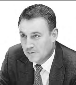
Дмитрий Патрушев, министр сельского хозяйства РФ:

— Урожай 2022 года позволит полностью обеспечить внутренние потребности России и расширить экспортные поставки. На сегодня обмолочены зерновые с 95 процентов площадей, собрано более 150 миллионов тонн. В 2022 году планируется собрать 25,5 миллиона тонн масличных, что является наивысшим показателем за всю историю России, более 43 миллионов тонн сахарной свеклы, семь миллионов тонн картофеля (в сельхозорганизациях и КФХ), около пяти миллионов тонн овощей открытого грунта.