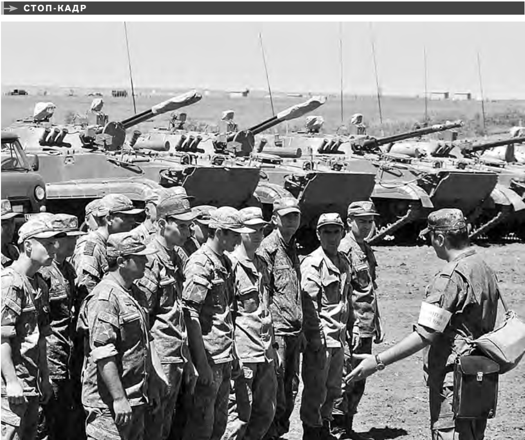
Символические ключи от новых модернизированных танков Т-72Б3М получили молодые бойцы 150-й мотострелковой дивизии на Кадамовском полигоне под Новочеркасском. Таким образом за личным составом закрепляют штатное вооружение и технику. Ключи также получили водители боевых машин пехоты и КаМАЗов.

В РЕСПУБЛИКЕ 133 школы—аварийные, а 131 —в ветхом состоянии. Еще в 546 требуется проведение капитального ремонта. На сайте, который появится в рамках проекта «Сто школ», будет размещена подробная информация об этих учебных заведениях. По задумке властей, портал поможет выйти на меценатов, которые смогли бы оказать финансовую помощь школам. Бюджет муниципалитетов пока не в полной мере справляется с их насущными проблемами.