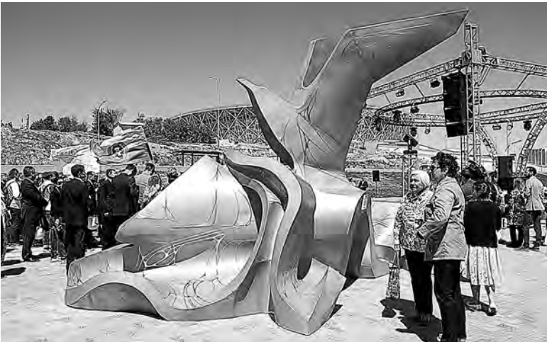
Художник-монументалист украсил набережную чайкой на волне.