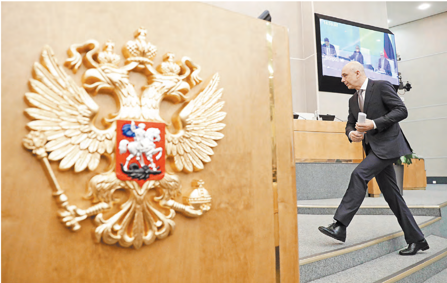
Министр финансов Антон Силуанов открыто признался в том, что этот бюджет — самый сложный в его профессиональной карьере.