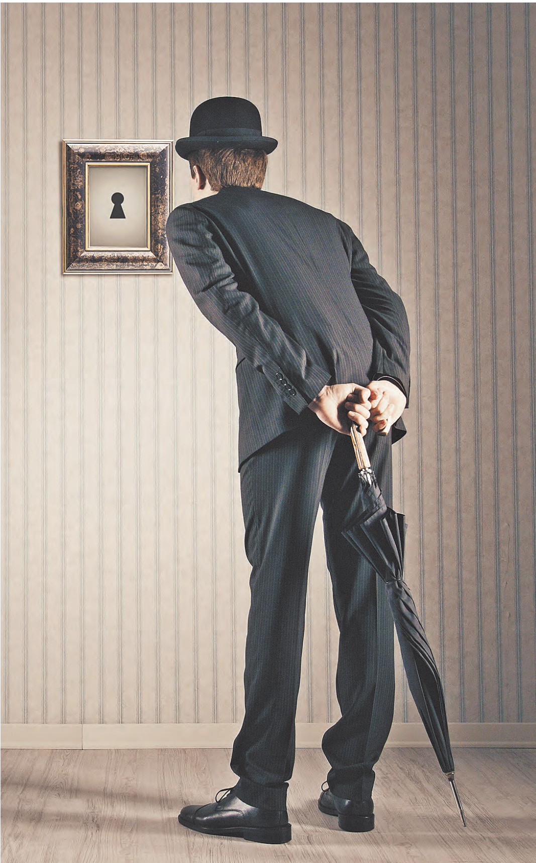
Вход на банковский рынок уже закрыт или ограничен для 6 675 менеджеров и владельцев проблемных банков.

Следующий шаг — распространение требований к репутации на клерков, выполняющих противоправные приказы начальства, а также введение понятия «теневое директорство» — лица, оказывающего влияние на решения, но формально не занимающего высокую должность.