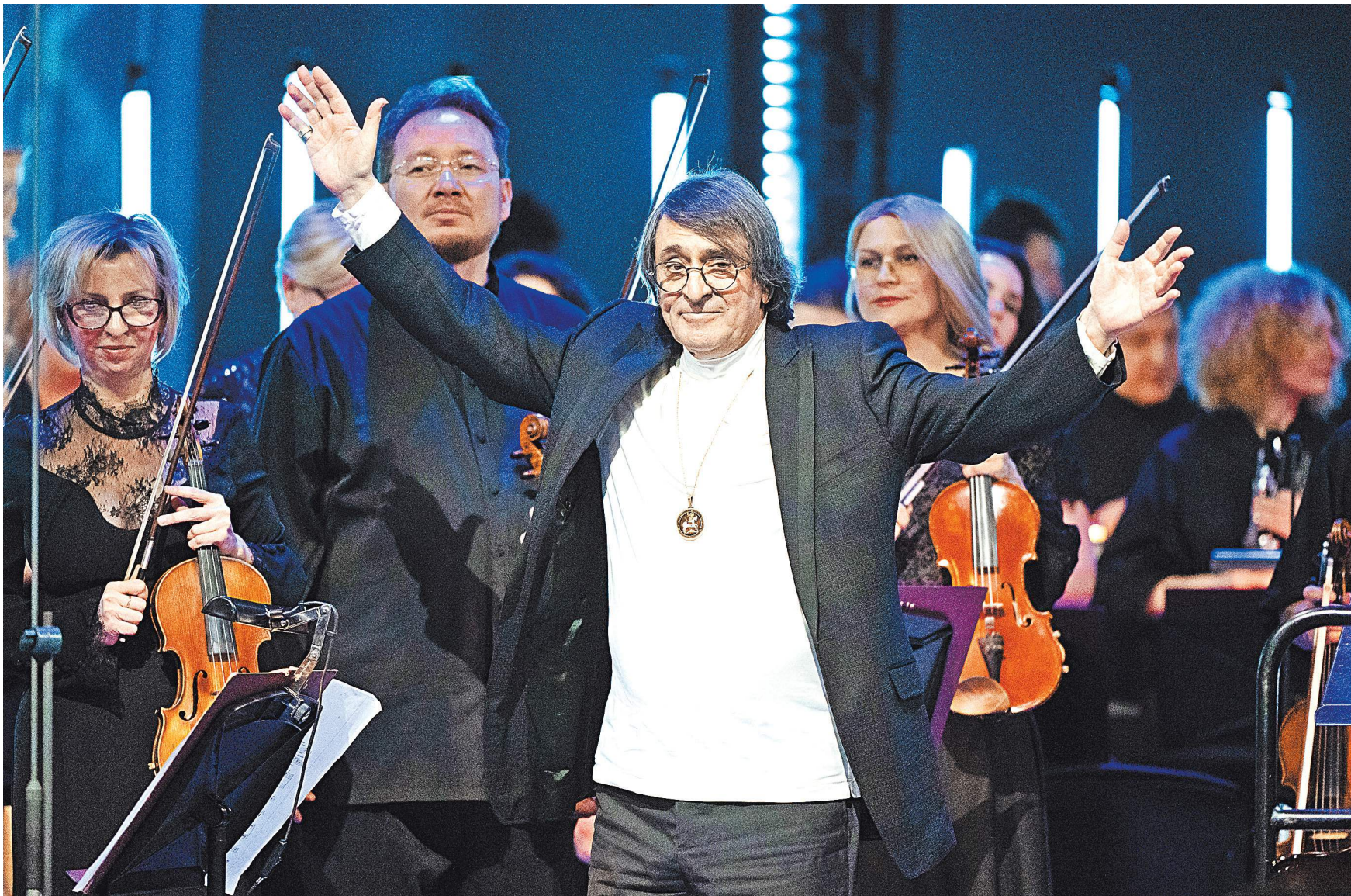
ПРЕСС-СЛУЖБА РУССКОГО КОНЦЕРТНОГО АГЕНТСТВА