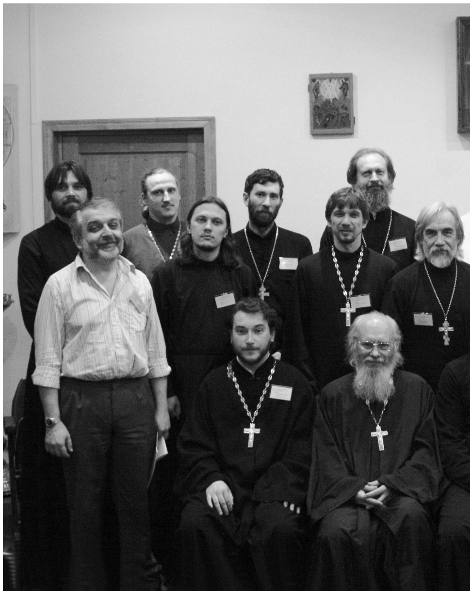
Докладчики и участники конференции «ТРАДИЦИЯ СВЯТООТЕЧЕСКОЙ КАТЕХИЗАЦИИ: современные вопросы подготовки катехизаторов»