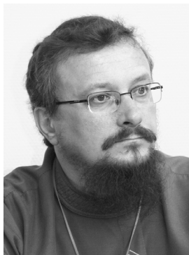
ИГУМЕН АРСЕНИЙ (СОКОЛОВ) (Лиссабон, Португалия)

Доктор богословия. Настоятель Всехсвятского прихода Московского Патриархата. Автор работ: «Книга Иисуса Навина: опыт историко-экзегетического анализа» (2005), «Книга пророка Амоса» (2012). Область интересов: экзегеза пророческих книг Танаха.