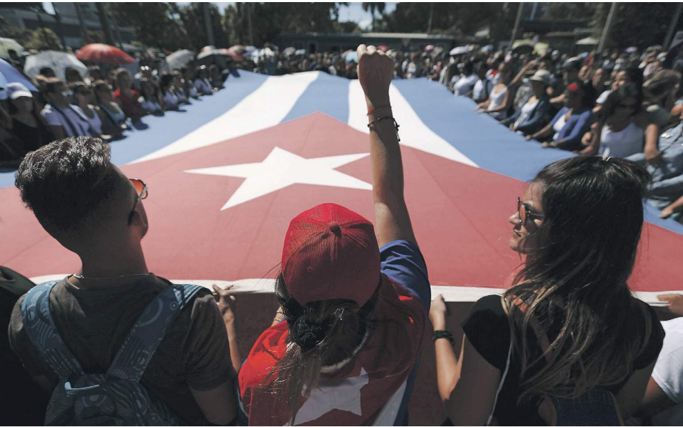
Желающие попрощаться с команданте часами стояли в очереди на 30-градусной жаре