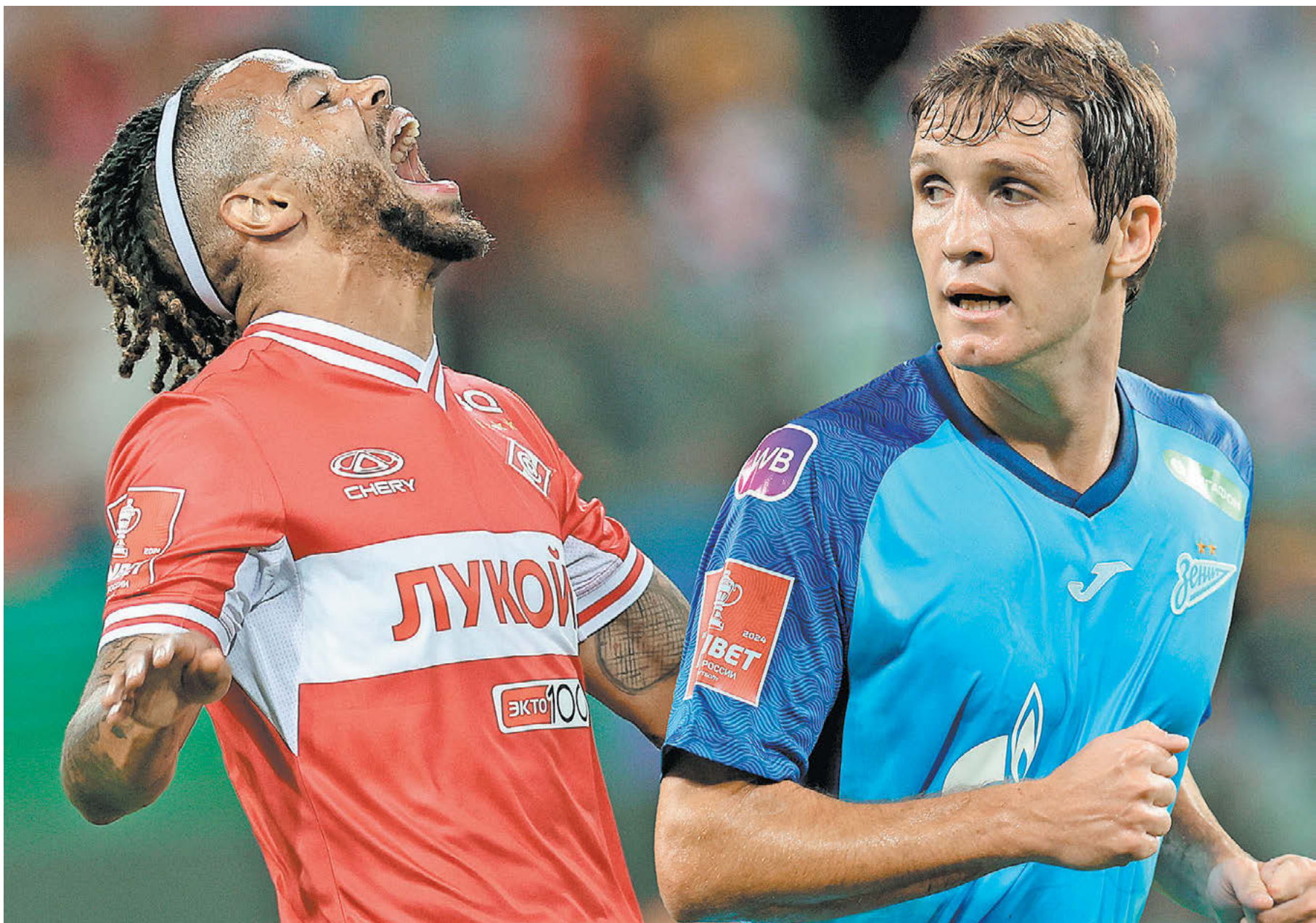
Звездный новичок «Спартак» Тео Бонгонда

Вчера в Москве состоялась пресс-конференция участников турнира «Бойцовский клуб РЕН ТВ. Суперсерия», который пройдет в пятницу, 18 августа