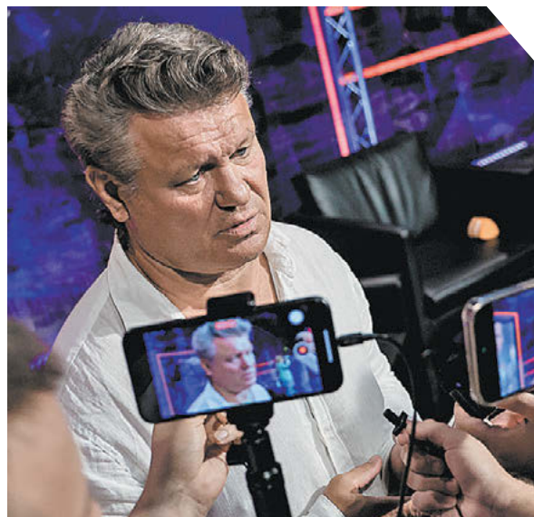
Дарья Исаева «СЭ». Снято на Canon

В воскресенье, 20 августа, на «Открытие Банк Арена» пройдет одна из ключевых игр всего чемпионата России-2023/24