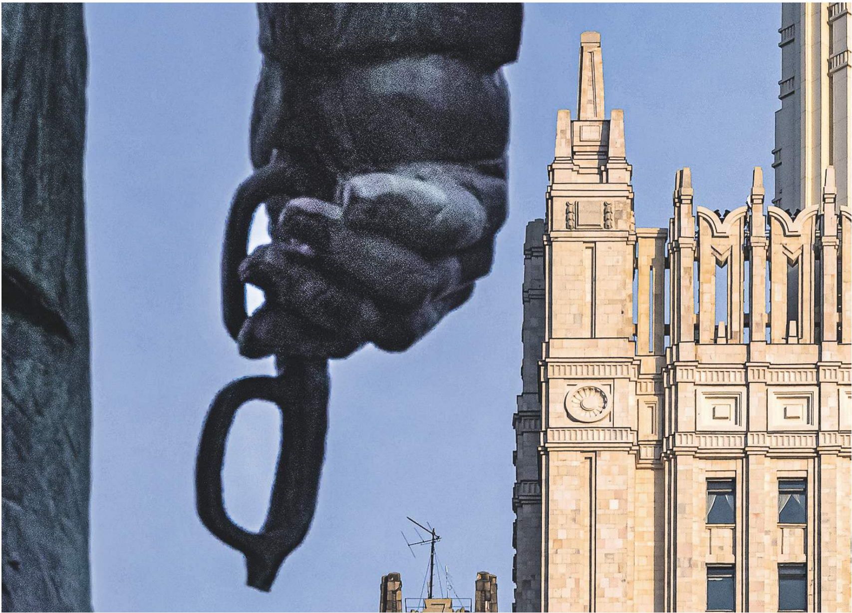
Константин Кошкин | «Известия»