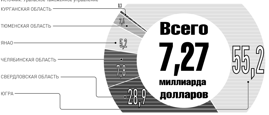
ИНФОГРАФИКА: РГ — ЕЛЕНА МАКЕР

ЕКАТЕРИНБУРГ: ул. Турганова, 13, офис 820. Телефон/факс (343) 371-24-84, 355-30-68. E-mail: san@rg-ural.ru ТЮМЕНЬ: ул. Осипенко, 81, офис 1004. Телефон/факс: (3452) 35-24-94, 35-25-11. E-mail: man72@mail.ru ЧЕЛЯБИНСК: Свердловский пр., 60. Телефон/факс: (351) 727-73-33, 727-78-08. E-mail: chel@rg.ru