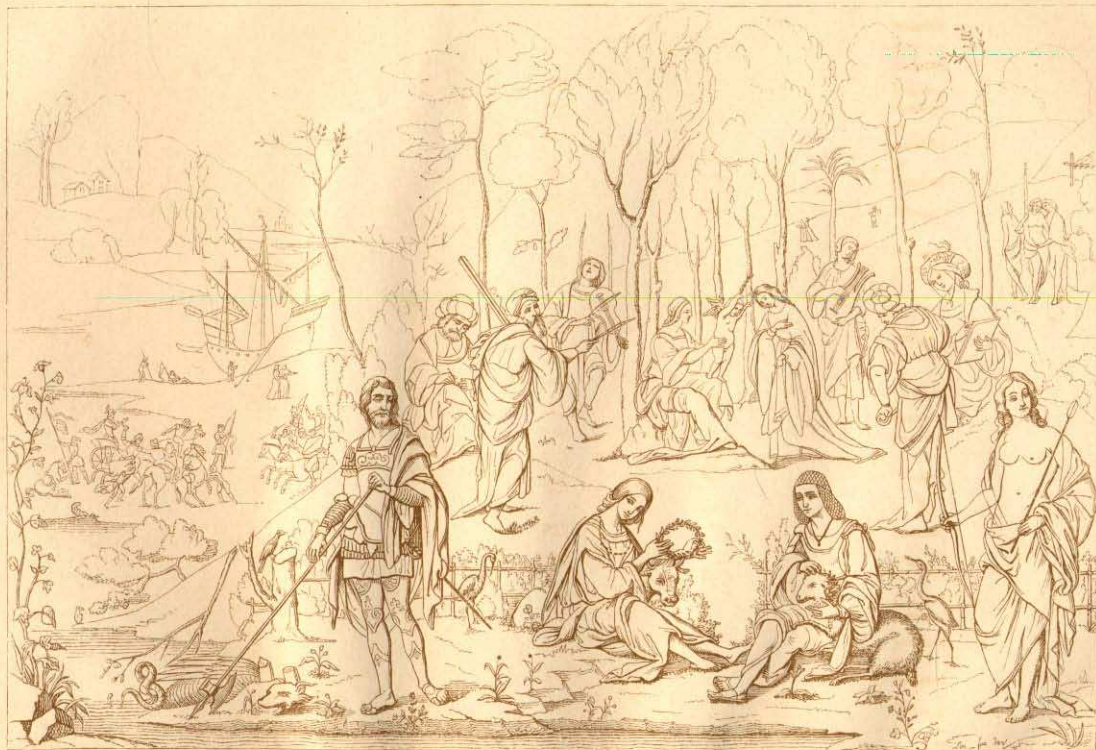
Der Musenhof der Isabella von Este, Gemälde des Lorenzo Costa im Louvre zu Paris.