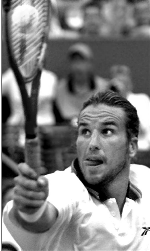
Вчера, Париж. Патрик РАФТЕР.

Женщины. Третий круг. Хингис (Швейцария, 1) - Хрдликова (Чехия) - 6:3, 6:4. Санчес (Испания, 7) - Спирия (Румыния) - 6:4, 6:1. В.Уильямс (США, 5) - Молик (Австралия) - 6:3, 6:1. М.Дж.Фернандес (США) - С.Уильямс (США, 10) - 6:3, 1:6, 6:0.