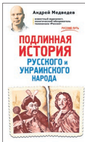
Андрей Медведев. Подлинная история русского и украинского народа. – М.: Эксмо, 2015, 560 с: ил. – 2000 экз.

На эти и многие другие вопросы поможет найти ответы эта взвешенная по своему содержанию книга известного политического обозревателя. Поможет