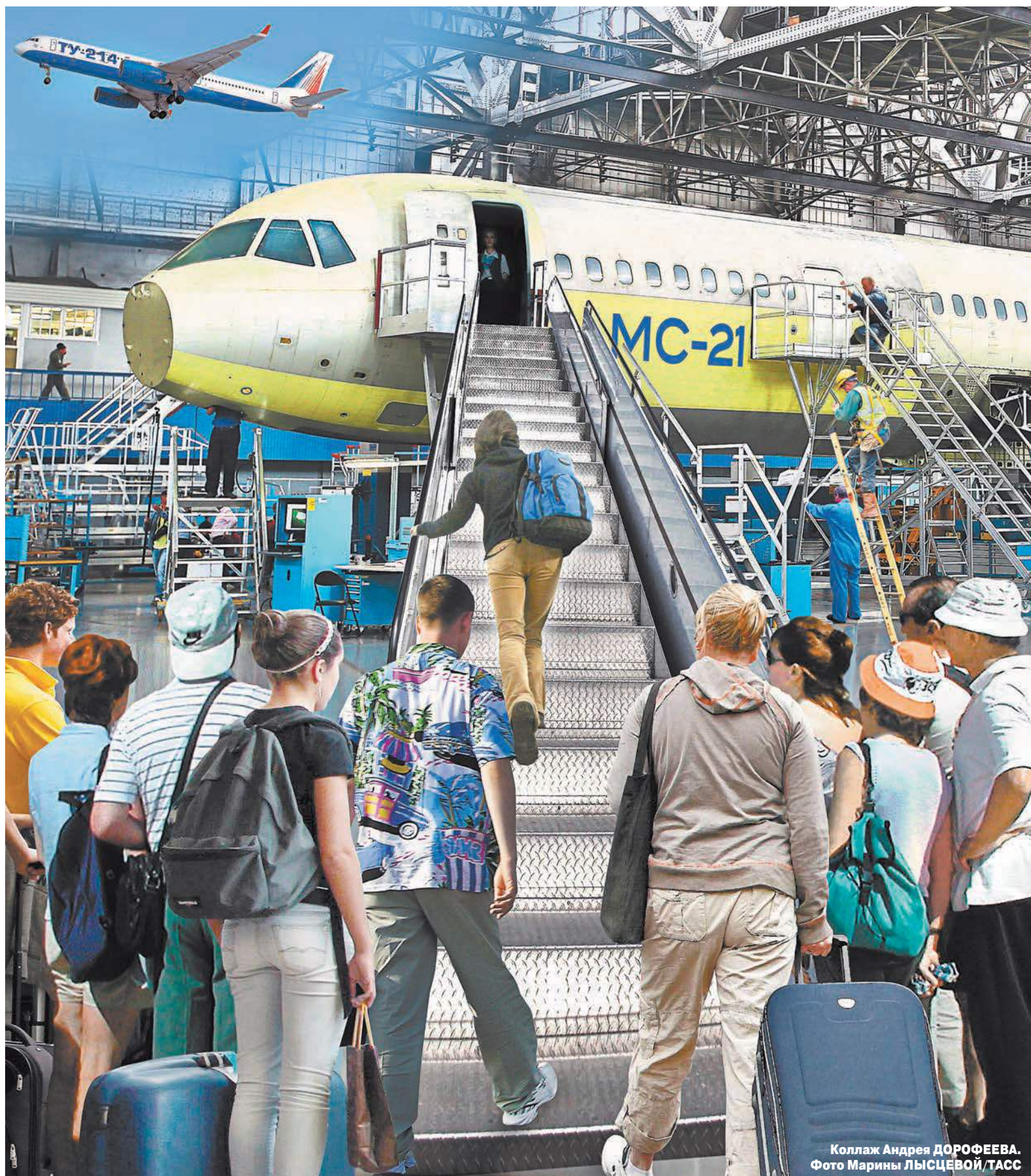
Коллаж Андрея ДОРОФЕЕВА. Фото Марины ЛЫСЦЕВОЙ/ТАСС

Владимир Мединский – об истории, которая повторяется «Внешние силы всегда пользуются любой внутренней смутой, чтобы подорвать единство нашего общества, сделать любой конфликт затяжным и кровопролитным». с. 6