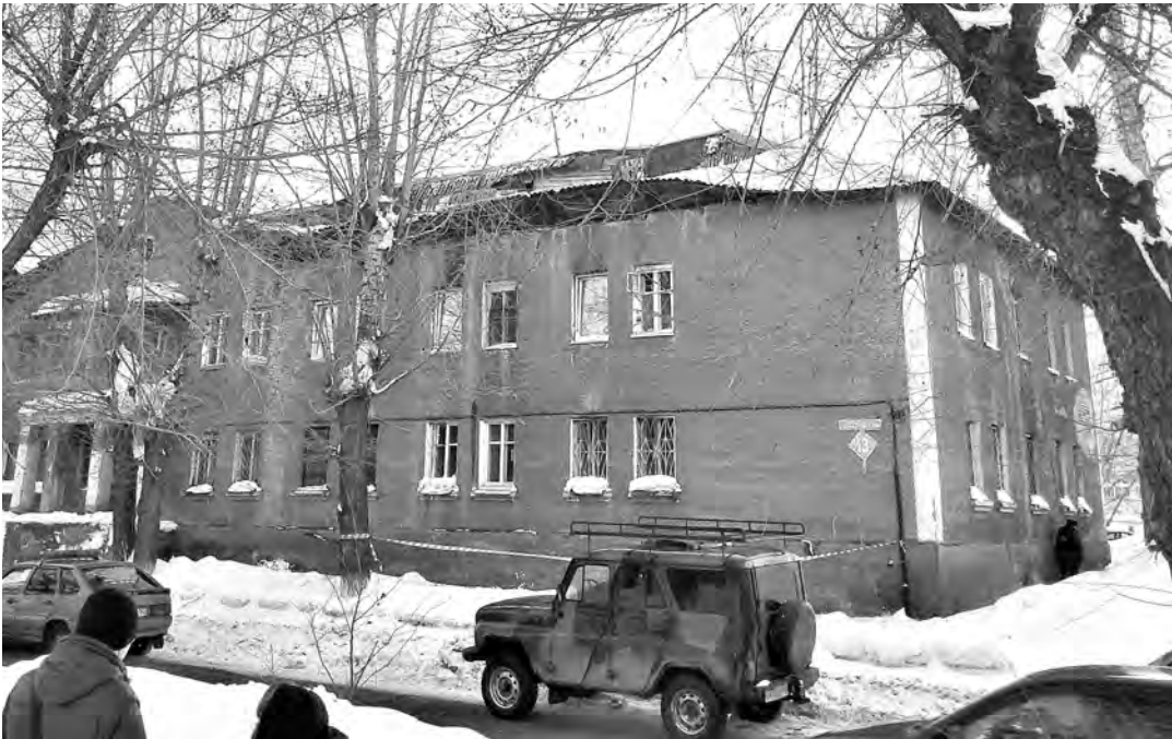
ПРЕСС-СЛУЖБА ГУ МЧС ПО КЕМЕРОВСКОЙ ОБЛАСТИ