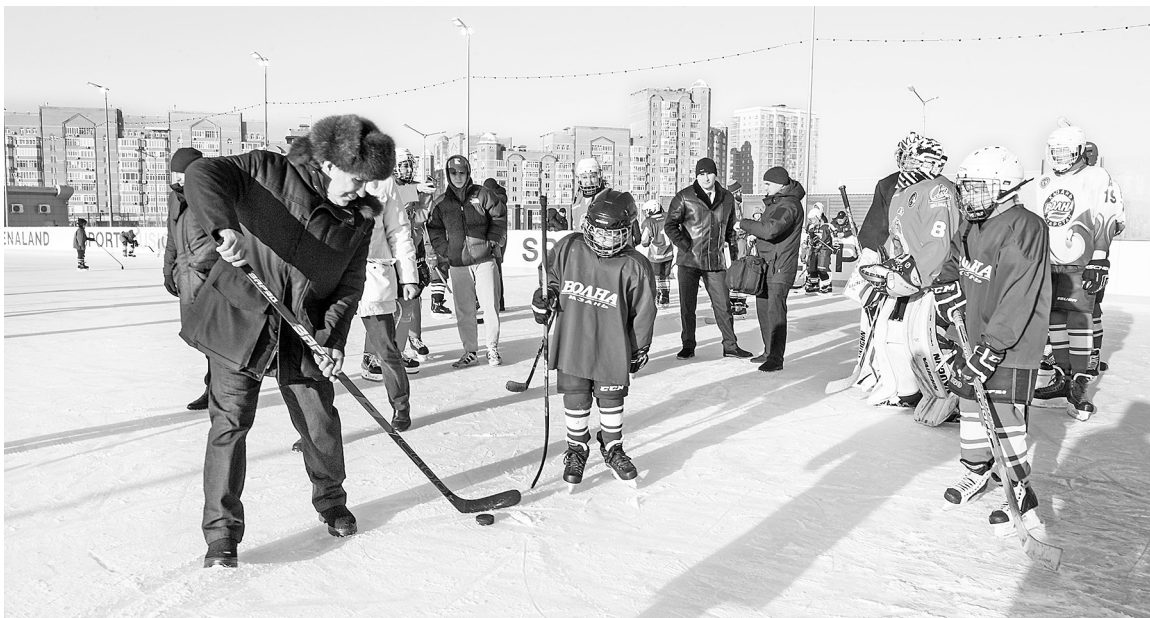
ПРЕСС-СЛУЖБА ПРЕЗИДЕНТА РТ