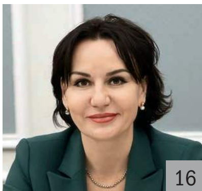
Н. Г. БРЮХАНОВА, министр финансов Ульяновской области