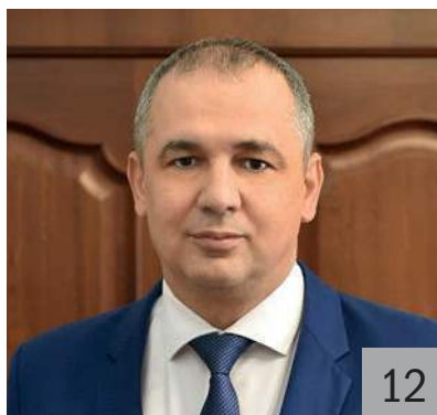
А. В. КНЫШОВ, министр финансов Краснодарского края

Негативная динамика связана с дефицитным исполнением бюджета и погашением части долга.