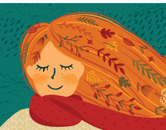
Рисунок на обложке: Shutterstock.com

Оформите подписку в ноябре, зарегистрируйтесь на сайте rosapteki.ru и получите В ПОДАРОК 500 баллов на счет Клуба РА