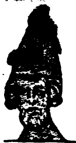
Папа Урбанъ II (Со старинной гравюры).

Шелъ 1095-й годъ. Въ Римѣ въ это время былъ папой Урбанъ II, который твердо рѣшилъ идти на помощь Византіи. Да и пора было. Императоръ Алексій отчаянно умолялъ папу оказать ему поддержку. И папа Урбанъ II рѣшилъ исполнить его просьбу. Онъ задумалъ начать дѣло именно съ этого, а затѣмъ, ослабивъ силу турокъ, идти на освобожденіе Палестины. Онъ хорошо видѣлъ настроеніе [народа, но только не былъ увѣренъ въ немъ,—поднимутся ли всѣ на самомъ дѣлѣ такъ