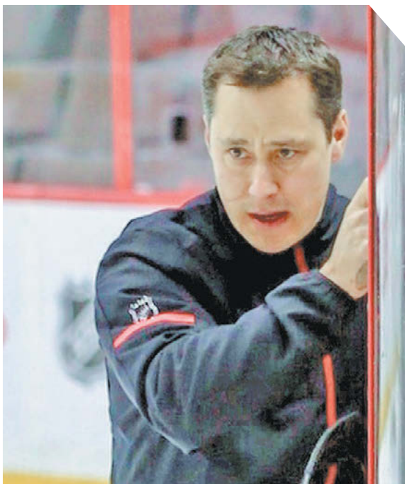
Global Look Press