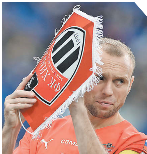
Александр Федоров «СЭ». Снято на Canon