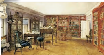
Библиотека. Дом-музей Грановского