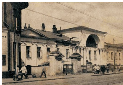
Дом Лобановых- Ростовских на Мясницкой улице в Москве