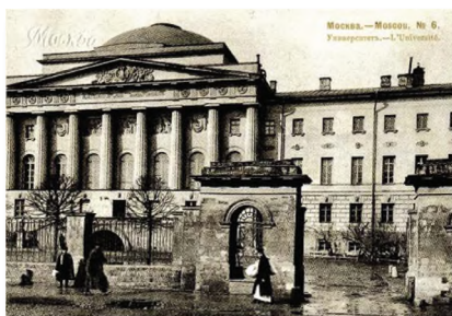
Старое здание Московского университета, где Грановский преподавал в 1839 — 1855 гг.