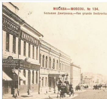
Дом Салтыкова на Большой Дмитровке

Здесь в 1826 — 1828 гг. находился частный пансион Кистера, где учился Т.Н. Грановский