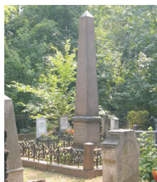
Могила Т.Н. Грановского на Пятницком (Крестовском) кладбище Москвы

Здесь в 1826 — 1828 гг. находился частный пансион Кистера, где учился Т.Н. Грановский