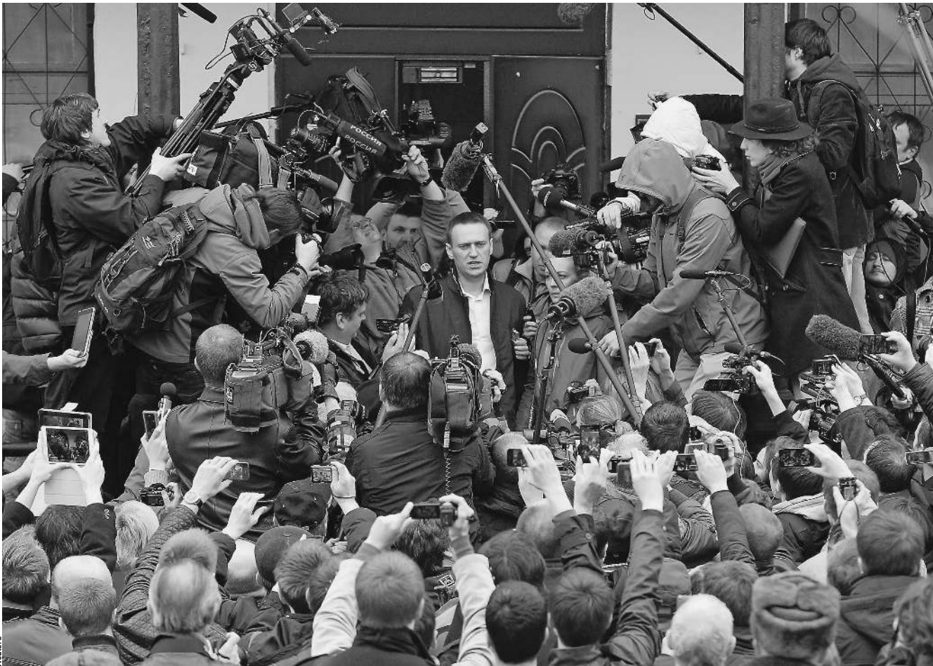
Происходившее в Кирове вокруг суда над Алексеем Навальным описал колумнист «Известий» Эдуард Лимонов