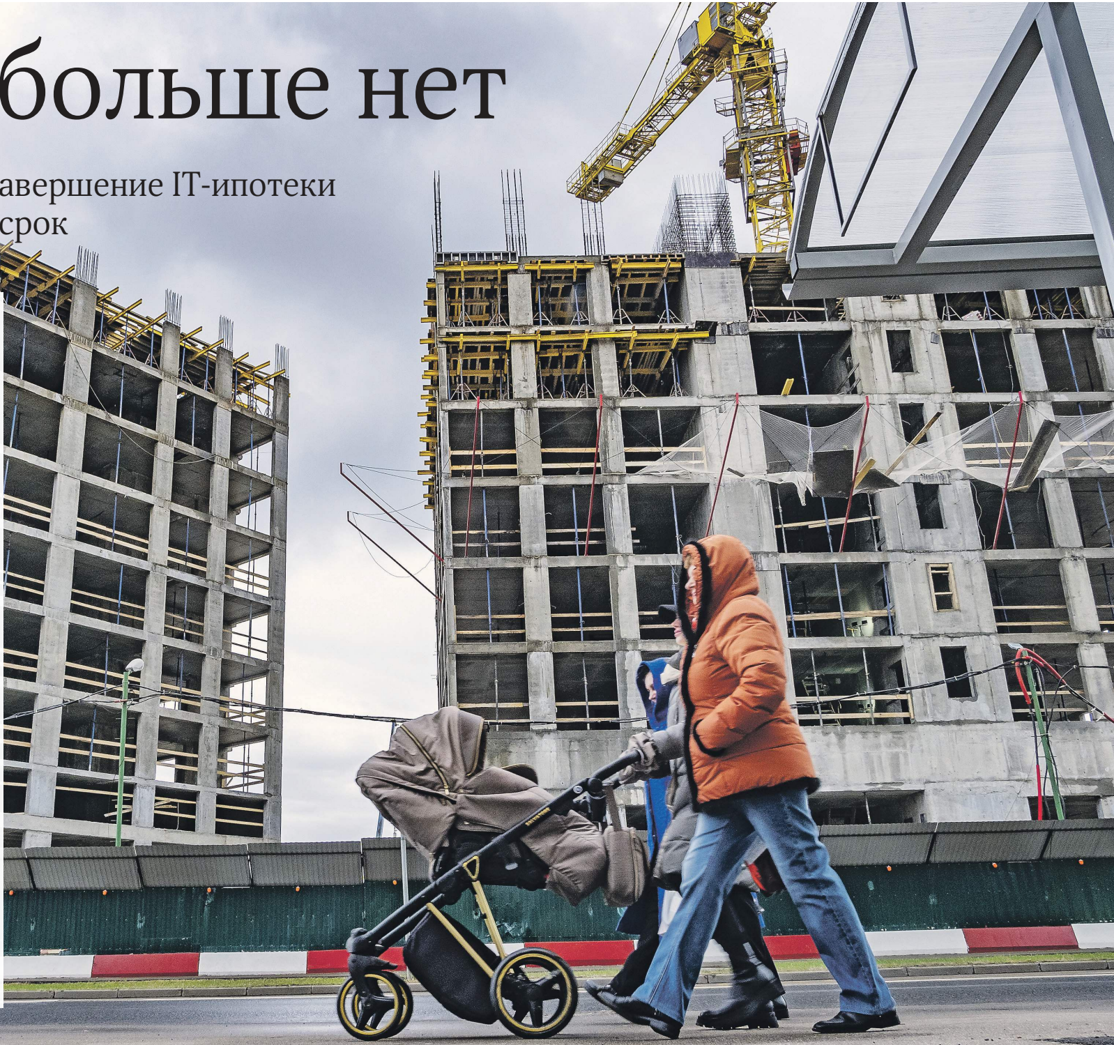
Константин Кошкин / Изнестия