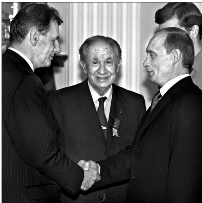
Вчера, Москва, Кремль. Владимир ПУТИН приветствует Жака РОГГЕ (слева) и Хуана Антонио САМАРАНЧА.

Вчера вечером президент Российской Федерации Владимир Путин принял в Кремле седьмого президента Международного олимпийского комитета Хуана Антонио Самаранча и избранного вчера на эту должность Жака Рогге. Отметив огромный вклад Самаранча в развитие олимпийского движения и укрепление мира, президент России поздравил Рогге с избранием на высокий пост и пожелал, чтобы Москва стала для него таким же близким и счастливым местом, каким была для его предшественника. Улыбаясь, Путин предложил в будущем всегда проводить выборы руководителей МОК в Москве. Жак Рогге поблагодарил президента России и заметил, что к его предложению имеет смысл вернуться через 8-12 лет. Кроме того, новый президент МОК выразил уверенность в том, что Москва будет достойно выдержать в споре городов, претендующих на право стать столицей Олимпиады-2012.