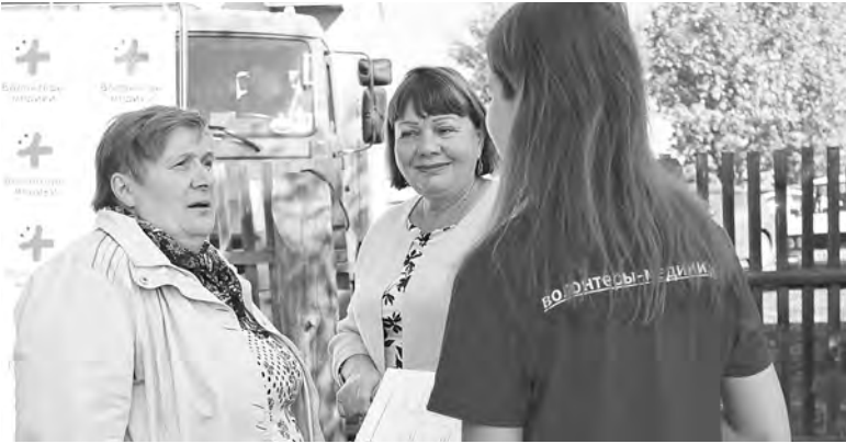
МИНИСТЕРСТВО ЗДРАВООХРАНЕНИЯ ИРКУТСКОЙ ОБЛАСТИ

— С молодежью работать куда веселее! Очень помогают ребята, правда. С теми, кто очереди ждет, поговорят, тех, кто нас за три вер-