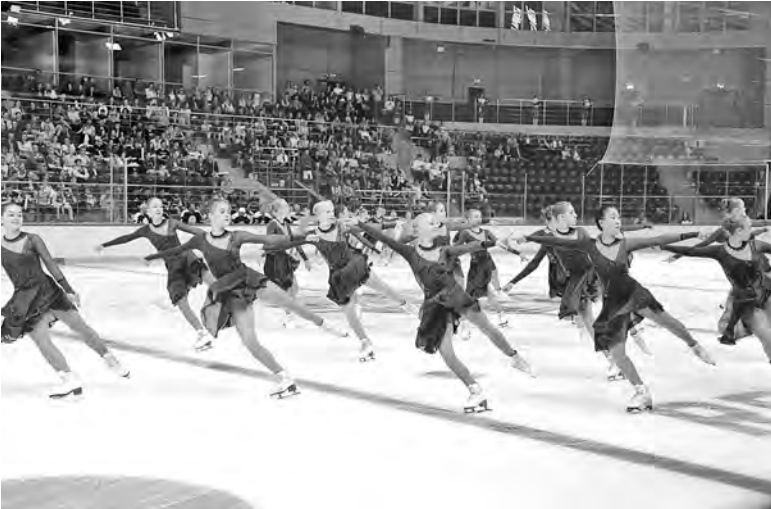
ПРАВИТЕЛЬСТВО КРАСНОЯРСКОГО КРАЯ

Кстати, ледовый дворец «Кристалл Арена» — один из крупней-