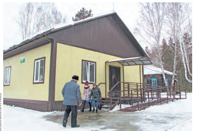
Здание врачебной амбулатории в Старом Просвете выглядит небольшим, но внутри оказалось вместительным.