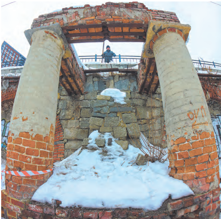
Подпорная стена плотины, украшенная массивными двухколонными портиками, полуразрушена.