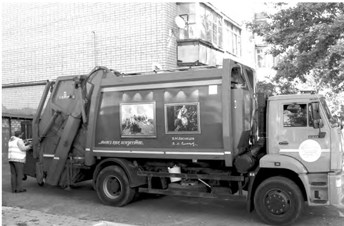
В Ставрополе мусоровозы еще и приобщают граждан к высокому искусству: здесь на бортах спецмашин – репродукции известных картин.

рублей выделено из бюджета РСО – Алаania на повышение заработной платы работников общеобразовательных учреждений республики в 2020 году.