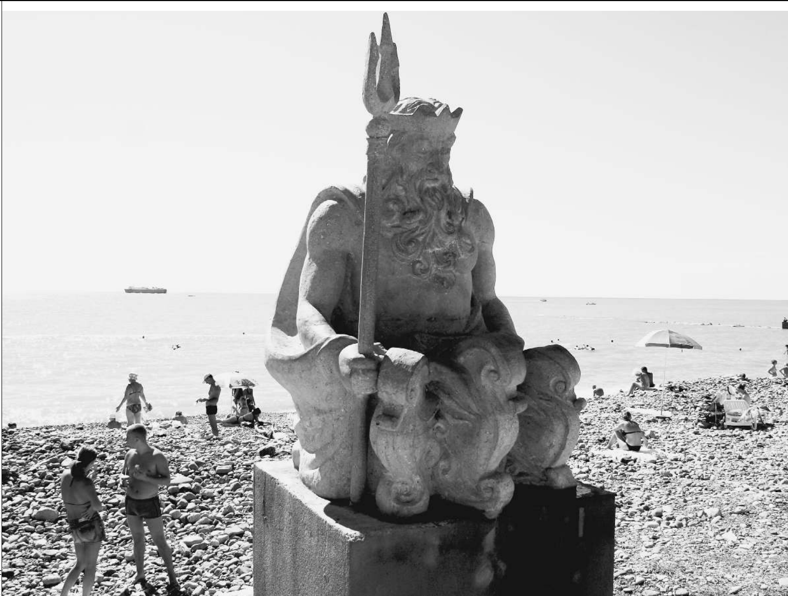
Состоятельные россияне присматривают себе недвижимость на курортах