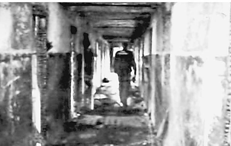
Огонь шел из комнаты отдыха по коридору на третьем этаже