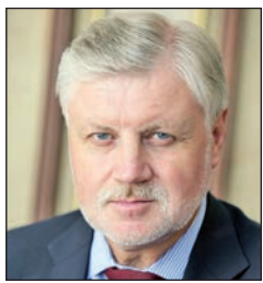
Сергей МИРОНОВ, председатель партии «Справедливая Россия»

В череде исторических дат и событий новейшего времени особенное значение приобретает 1000-летие памяти святого равноапостольного князя Владимира (960–1015). С его именем связывают начало процесса, последствия которого не имеют ничего равного в национальной истории. Это обращение славянского населения Руси в христианство, самоопределение народа на основе христианской веры. Именно при Владимире мы окончательно стали русскими.